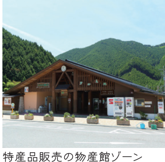
特産品販売の物産館ゾーン