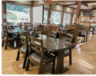
レストラン車留満の店内

自然を見ながら食事を楽しんでいただけます。天気の良い日はテラスもご利用いただけます。