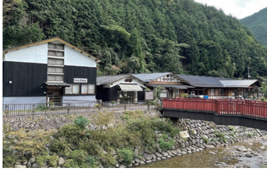
杉原紙の里ゾーン