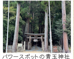
パワースポットの青玉神社

境内に群生している7本の大杉は、兵庫県指定の天然記念物として登録され、推定樹齢1,000年と言われる杉が複数あります。