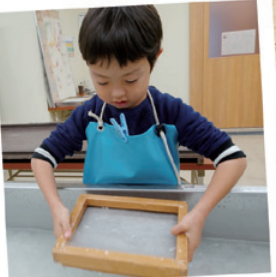
杉原紙の手漉き体験の様子

境内に群生している7本の大杉は、兵庫県指定の天然記念物として登録され、推定樹齢1,000年と言われる杉が複数あります。