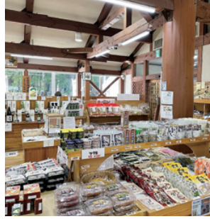
地元の特産品などを販売