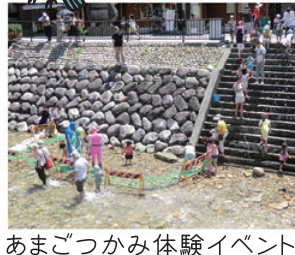
あまごつかみ体験イベント