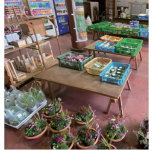
朝市は毎週土曜日、日曜日に開催