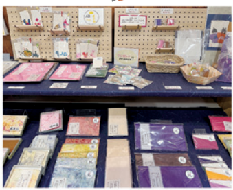
1000年以上の歴史と伝統を持つ和紙・杉原紙